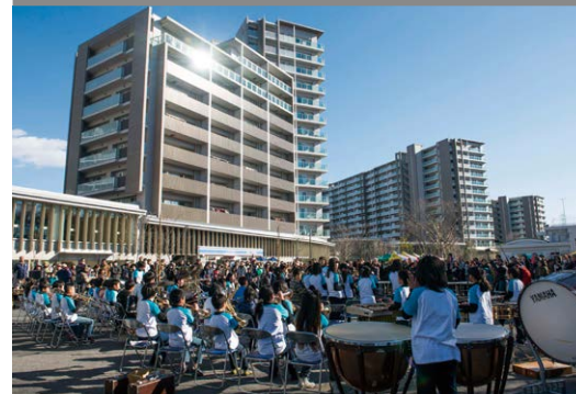
분양주택의 개축에 의한 거리의 새모습 스와니초메 주택 (다마 시)

고도 경제성장기에 공급된 주택의 새로운 개축에 맞춰 서비스가 제공되는 고령자용 주택이나 클리닉, 탁아소, 교류 시설등을 정비