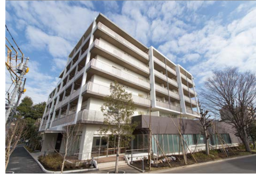
주택의 개축에 맞춰 다세대 공동생활 고샤하임 지토세카라스야마 (세타가야구)

고도 경제성장기에 공급된 주택의 새로운 개축에 맞춰 서비스가 제공되는 고령자용 주택이나 클리닉, 탁아소, 교류 시설등을 정비