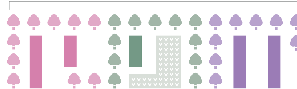
단지를 개수, 다양한 거주지를 실현 다마다이라노 모리 (히노 시)