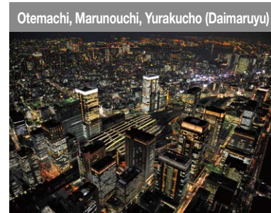
Otemachi, Marunouchi, Yurakucho (Daimaruyu) Premier quartier des affaires au Japon. Ces dernières années, est en cours la transformation de cette zone en espace vivant animé.

Le partage de rôles d'une variété de sièges, avec leurs fonctions intégrales, favorisent la croissance de Tokyo.