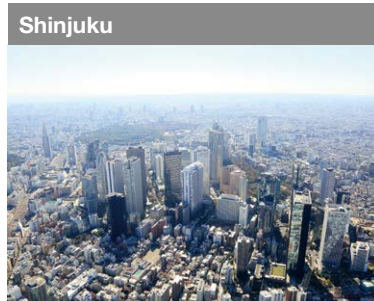
Shinjuku Un demi-siècle après le développement du site de l'ancienne station d'épuration des eaux de Yodobashi, le quartier d'affaires entre dans une période de réaménagement.