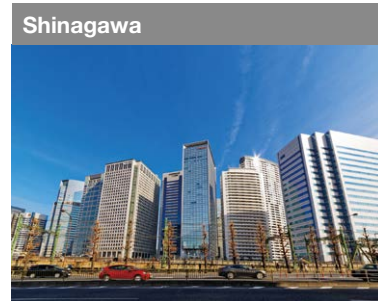
Shinagawa Près de l'Aéroport de Haneda, le développement de la zone est en cours comme plaque tournante de l'échange international