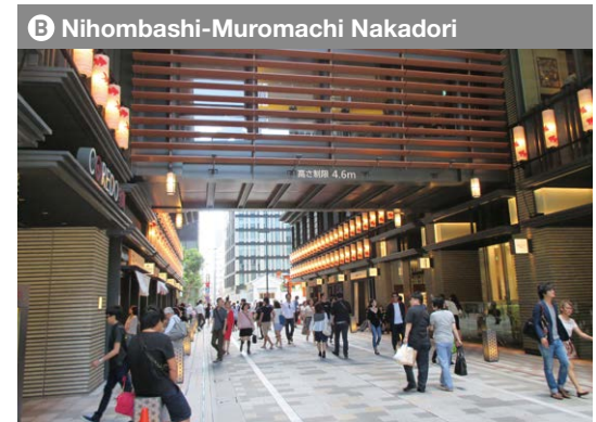
B Nihombashi-Muromachi Nakadori Horario de zona peatonal: Días de semana, fin de semana y feriados: 11AM - 8PM