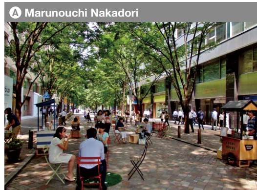
A Marunouchi Nakadori Horario de zona peatonal: Días de semana: 11AM - 3PM Fin de semana y feriados: 11AM - 5PM