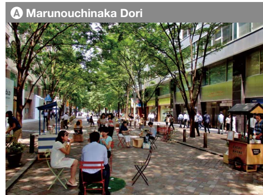
A Marunouchinaka Dori Fahrzeug freie Zeit Werktag: 11 :00-15 :00 Uhr Wochenende und Feiertage : 11 :00-17 :00 Uhr