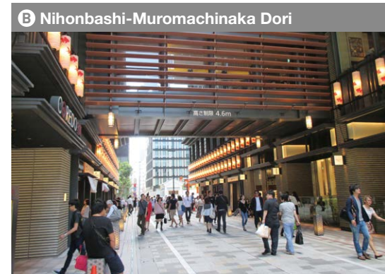
B Nihonbashi-Muromachinaka Dori Fahrzeug freieZeit Werktag, Wochenende und Feiertage : 11 :00-20 :00 Uhr