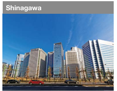
In der Nähe vom Flughafen Haneda entwickelt sich Schinagawa als Standort zum internationalen Austausch.