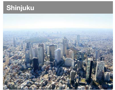
Ein halbes Jahrhundert später nach der Entwicklung auf dem Gelände der ehemaligen Yodobashi Kläranlage, steht dieses Büroviertel vor der Erneuerung.