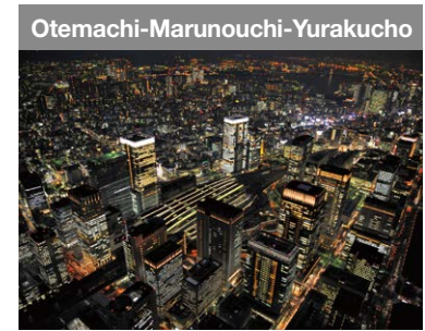
Japans erstes Geschäftsviertel. In den letzten Jahren hat es sich zu einem belebten Ort.

Tokio ist das Geschäftszentrum, wo die zentrale Funktion der inländischen und ausländischen Unternehmen abläuft. Während ein Gebiet erneuert werden muss, setzen andere Gebiete ihre Funktionen fort, so dass Tokios Geschäftsleben nie zum Stillstand kommt. Verschiedene Geschäftszentren, die durch ihre eigene Rolle das nahtlose Funktionieren ermöglichen, unterstützen das Wachstum von Tokio.