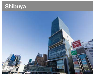
Des belebte Stadtviertel als Kulturzentrum zieht immer mehr IT-Unternehmen an.