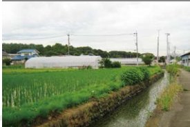
A Hino Bewässerungskanal