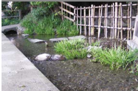
B Mamashita Brunnen