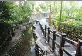
C Brunnen von Otakanomichi/ Masugata Teich