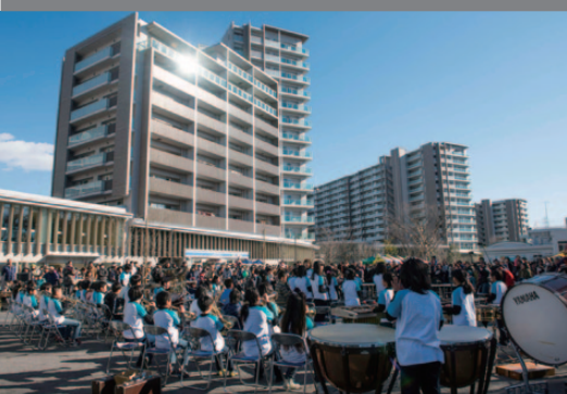
分譲住宅の建替えによるまちの再生 諏訪二丁目住宅(多摩市)

高度経済成長期に供給された住宅の建替えに併せ、サービス付き高齢者向け住宅やクリニック、保育所、交流施設等を整備