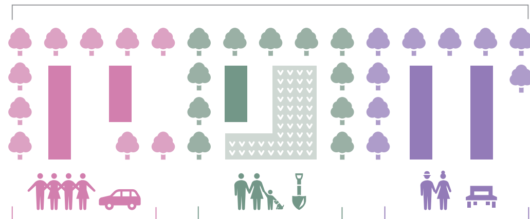
団地を改修し、多様な住まいを実現 多摩平の森(日野市)

A 団地型 シェアハウス カーシェアリング アトリエ住戸 デッキテラス こもれび広場 アウトドア・ダイニング