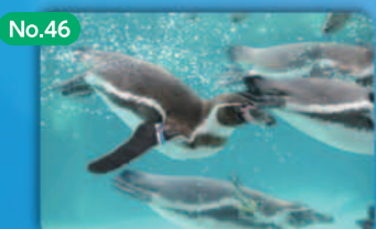
No.46 動物の飼育・繁殖による生物多様性保存への貢献 Zoos Contributing to the Conservation of Biological Diversity