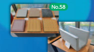
No.58 焼却灰の有効利用「エコセメント」 Recycling Incinerator Ash into Eco-Cement