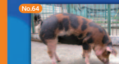
No.64 ブランド豚「トウキョウX」 Development of Tokyo X—Tokyo's Own Brand of Pork