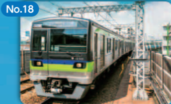
No.18 正確かつ高頻度、安全・安心な 鉄道システム A Safe and Reliable Railway System