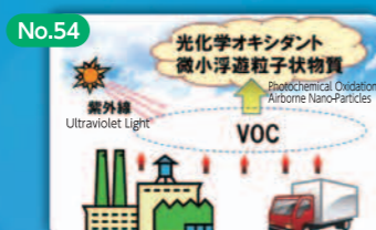
No.54 VOC 排出削減による 大気汚染防止 Preventing Air Pollution through the Reduction of VOC Emissions