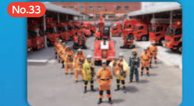
No.33 特殊災害対応技術 Response Technology for Special Incidents

流域対策や調節池等による 浸水被害の軽減 Reduction of Flood Damage through River Basin Measures and Flood Control