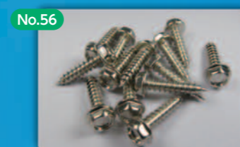
No.56 環境低負荷型 クエン酸ニッケルめっきの開発 Nickel Electroplating Method with Low Environmental Impact