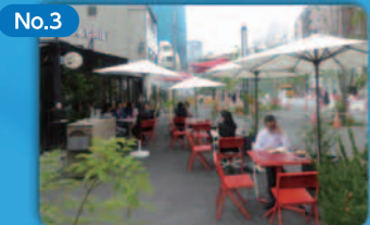
No.3 官民連携による地域の特性を活かしたまちづくり Use of Urban Planning Systems to Achieve Policy-Led Urban Development