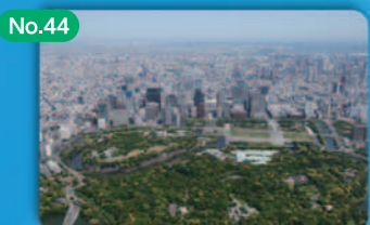
No.44 美しく風格ある景観の形成 Creation of Beautiful, Elegant Cityscapes