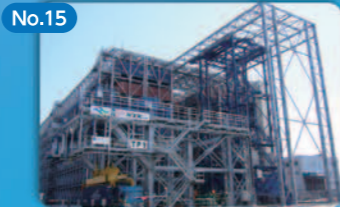
No.15 コンテナ立体格納庫の整備 Construction of a Multilevel Container Warehouse