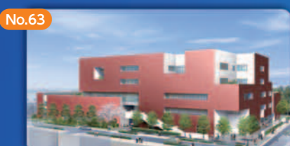
No.63 職業訓練施設の設置・運営技術 Vocational Training Facilities

世界に誇る都有建築物の 省エネ・再エネ東京仕様 Specifications to Make TMG-Owned Buildings Greener