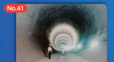
No.41 調節池等による中小河川の洪水対策 Flood Control through Regulating Reservoirs