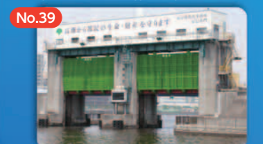
No.39 海岸保全施設の整備と運営 (高潮・津波対策) Development and Management of Shoreline Protection Facilities