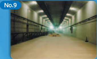
No.9 海底トンネル (沈埋工法) Undersea Tunnel (Immersed Tunnel Method)