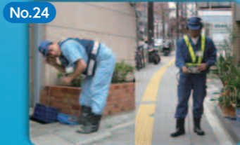
No.24 無収水削減技術 (漏水調査) Technology for Non-Revenue Water Reduction (Leakage Investigation)