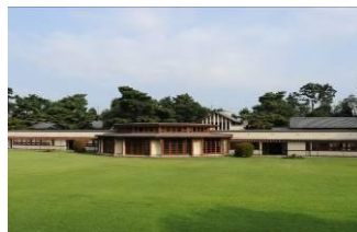
自由学園女子部体操館 （昭和9（1934）年）