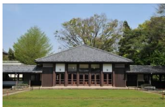
自由学園初等部食堂 （昭和6（1931）年）