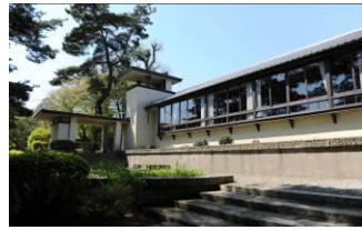
自由学園女子部講堂 （昭和9（1934）年）