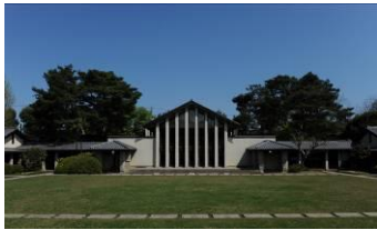
自由学園女子部食堂 （昭和9（1934）年）