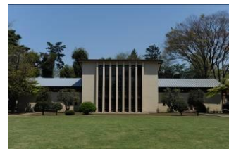
自由学園男子部体育館 （昭和11（1936）年）