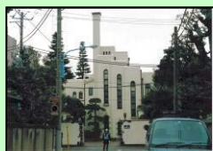
日立目白クラブ (新宿区)