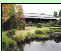
柴又帝釈天題経寺大客殿 (葛飾区)