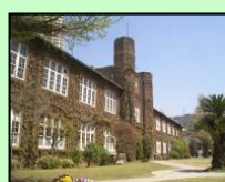
立教大学本館【モリス館】(豊島区)