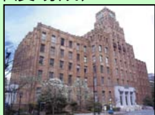
市政会館 (千代田区)