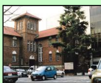
早稲田奉仕園(新宿区)