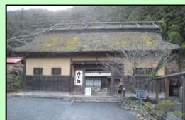
丹三郎屋敷長屋門 (奥多摩町)