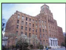
市政会館 (千代田区)