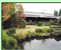
柴又帝釈天題経寺大客殿 (葛飾区)