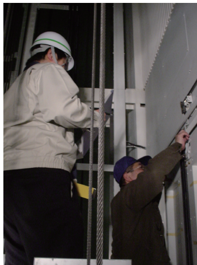
大規模ビルにおける 完了検査