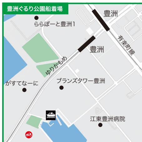
東京都江東区豊洲5丁目1番地先●ゆりかもめ「豊洲駅」から徒歩10分●ゆりかもめ「新豊洲駅」から徒歩7分