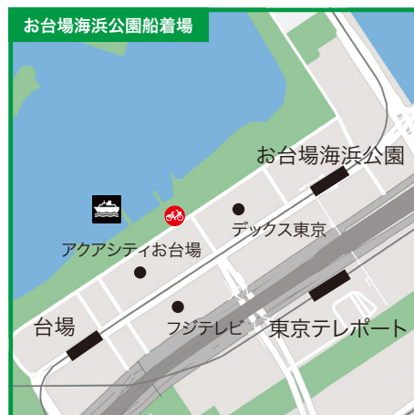
東京都港区台場1-4地先●ゆりかもめ「台場駅」または「お台場海浜公園駅」徒歩7分●りんかい線「東京テレポート駅」徒歩10分