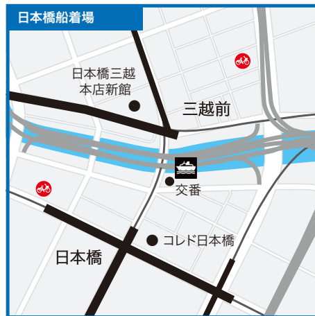
東京都中央区日本橋一丁目9番先(日本橋川)●銀座線・東西線・都営浅草線「日本橋駅」B12出口徒歩3分●銀座線・半蔵門線「三越前駅」B6出口徒歩1分