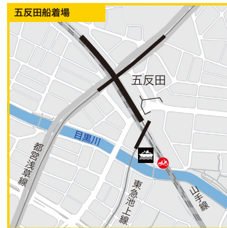
東京都品川区西五反田1丁目10番地先●JR山手線「五反田」駅徒歩5分、都営浅草線「五反田」駅徒歩5分●東急池上線「五反田」駅徒歩3分