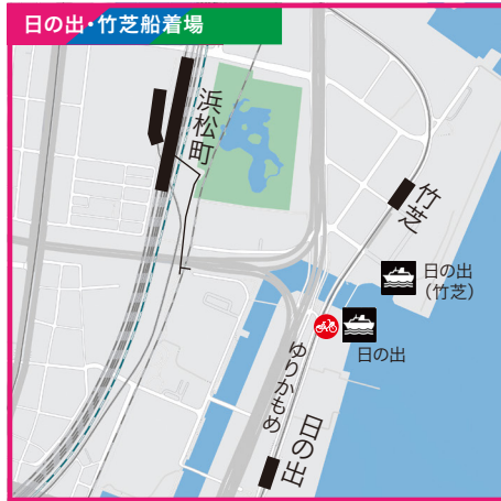
東京都港区海岸2-7-103地先●JR山手線・京浜東北線「浜松町」駅南口徒歩9分●新交通ゆりかもめ「日の出」駅東口徒歩4分