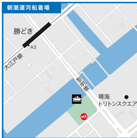
東京都中央区晴海3-1先 黎明橋下 区立黎明橋公園前●都営大江戸線「勝どき駅」A3出口より徒歩10分