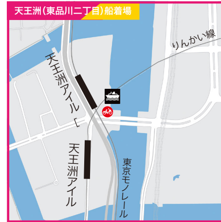
東京都品川区東品川2丁目3の2地先●東京モノレール「天王洲アイル」南口から徒歩1分●りんかい線「天王洲アイル駅」A出口より徒歩3分