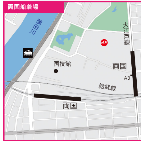
東京都墨田区横網1丁目地先●JR総武線「両国駅」西口より徒歩3分