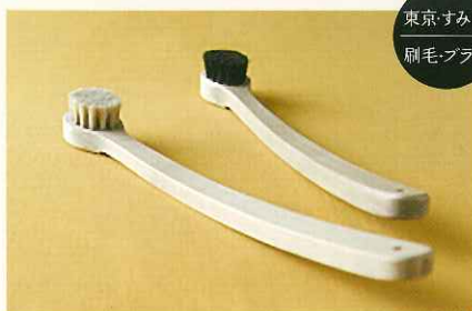
東京 すみだ 刷毛・ブラシ

宇野刷毛ブラシ製作所 〈毎月土日〉 すみだで大正6年に創業。刷毛を中心とした手植えの技術を継承しつつ、時代のニーズに応じて多様な刷毛・ブラシを製造しています。使うほどに愛着がわく天然素材の温かみを、実際にお手に取ってお試しください。