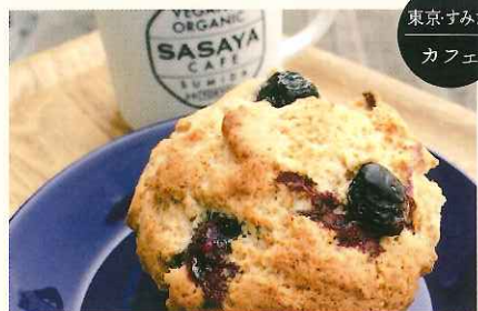
東京 すみだ カフェ

日本全国からこだわりの生産者が大集結！ 生産者と直接“話して、学び、旬を食べる”普段の暮らしにステキな出会いが生まれます。