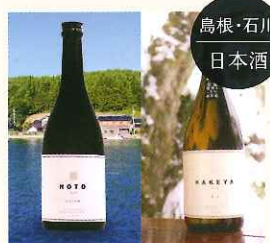
鳥根・石川 日本酒

日本酒応援団 〈9/24(土)、25(日)〉 鳥根県と石川県の小さな蔵元で、スタッフ自ら醸造にも関わり、全量「舟搾り」という昔ながらの手法で手作りしました。日本酒のもっとも純粋な形である「純米・無濾過生原酒」という種類の貴重なものです。 ・日本酒 (KAKEYA2016 純米無濾過生原酒720ml)