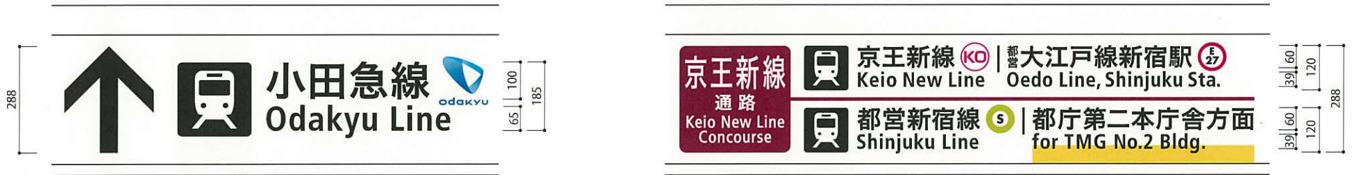
J2-01 -a 表示面寸法H350×W3670 (和文文字高60, 100)