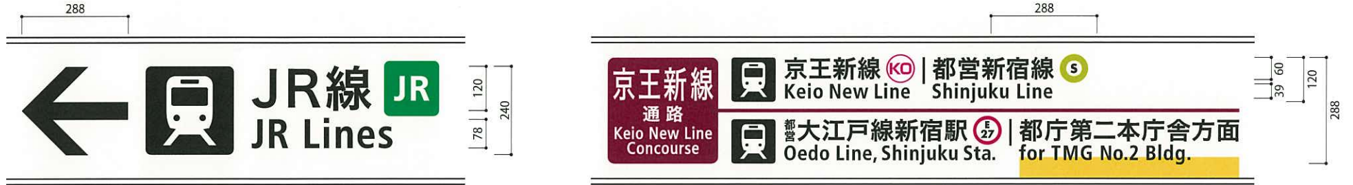
05-01 -a 表示面寸法H370×W8170 (和文文字高60,120)