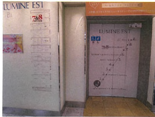
EV-K01 拡大図 (S=1/4)