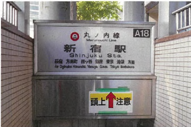
西-3007<片面> 表示面寸法H620×W1550 (和文文字高93,75,50)