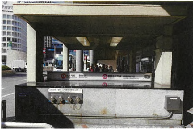
西-3015<片面> 表示面寸法H190×W3330 (和文文字高70)