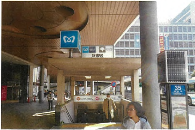
西-3014<片面> 表示面寸法H400×W3330 (和文文字高135,85,57)