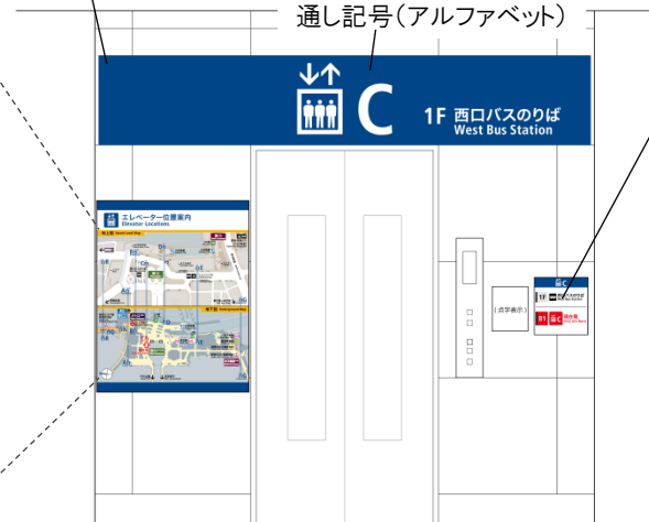
<エレベーター付近>