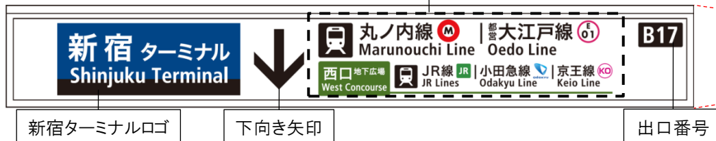
新宿ターミナルロゴ