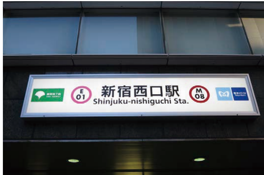
西-5009<片面> 表示面寸法H2440×W1830 (和文文字高180,135)