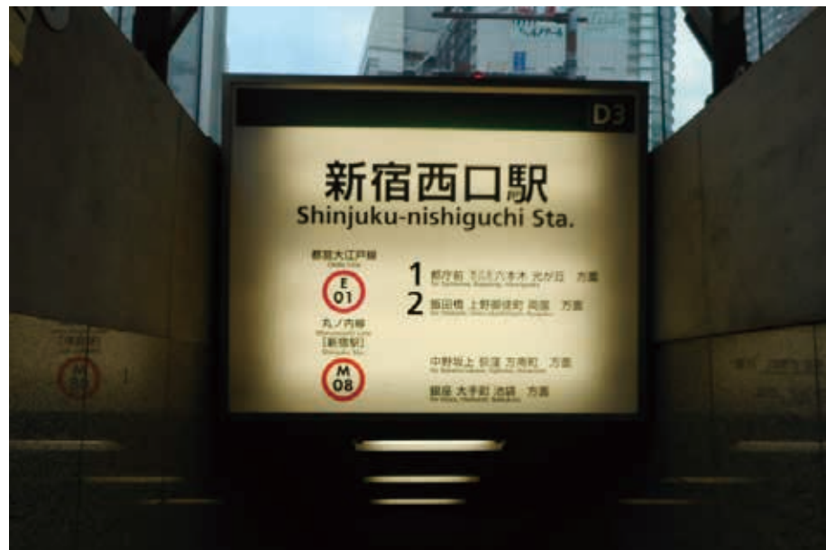
西-5004<片面> 表示面寸法H1195×W1495 (和文文字高130,100)