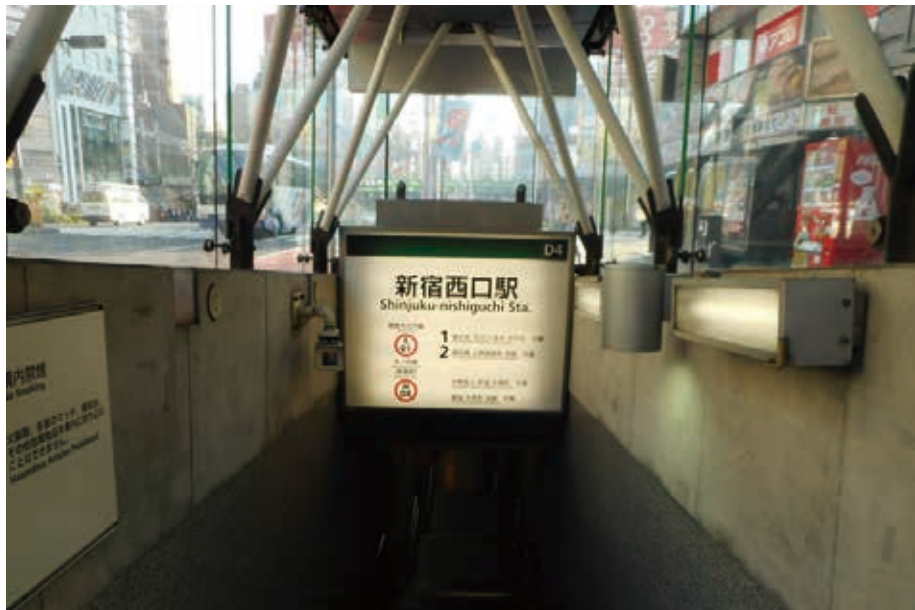
西-5006<片面> 表示面寸法H1195×W1495 (和文文字高120,100)