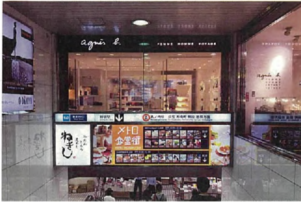
西-3012<片面> 表示面寸法H240×W5200 (和文文字高90,87.5,70)