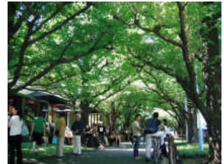
沿道のみどり豊かな歩行空間（神宮外苑のイチヨウ並木）