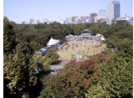
東京のみどりの拠点となる都市計画公園・緑地（開園百年を迎えた日比谷公園）