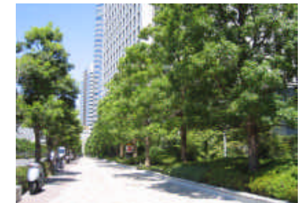
みどりのネットワークに配慮した植栽（グランドコモンズ）