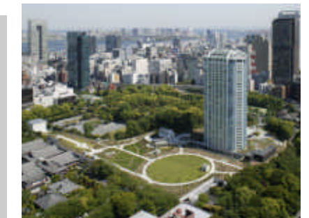
従来型の民間による公園づくりの一例（芝公園の特許事業の例）

（注）「みどりの新戦略ガイドライン」の本編は東京都都市整備局のホームページでご覧になれます。