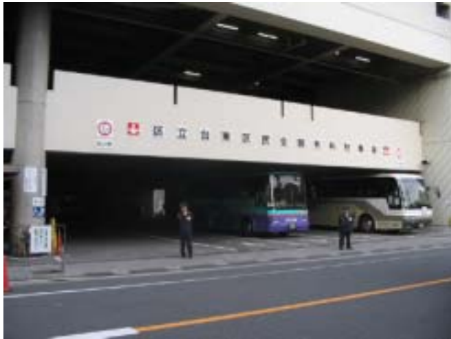
[ 観光バス駐車場正面 ]