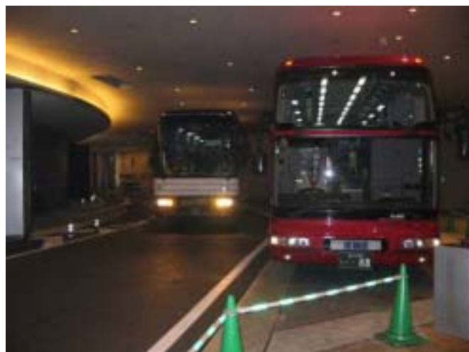
[ 六本木ヒルズ内観光バス専用車寄せ ]