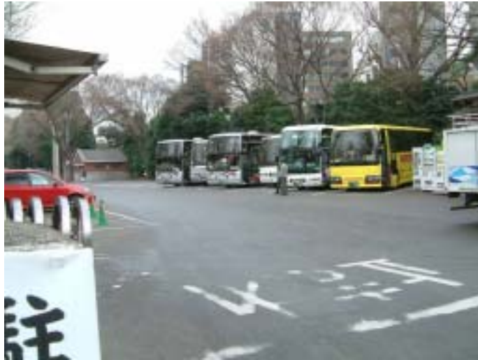
[ 観光バス駐車状況 ]