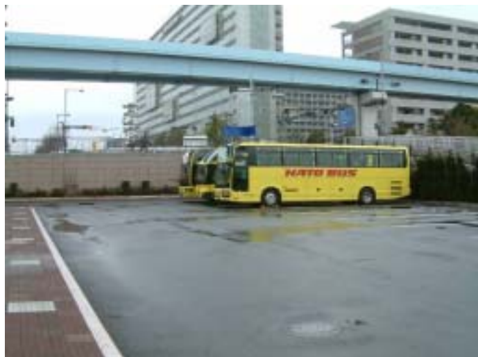
[ 観光バス駐車状況 ]