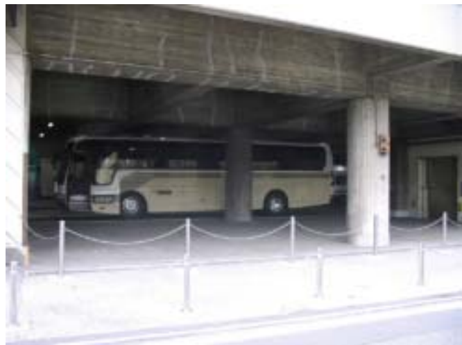
[ 観光バス駐車状況 ]