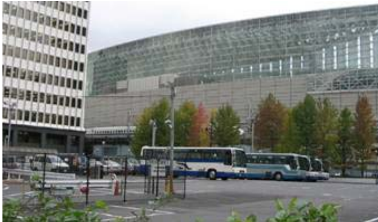
[ 観光バス駐車状況 ]