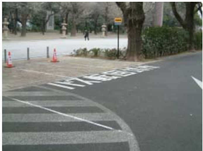
[ 観光バス転回スペース ]