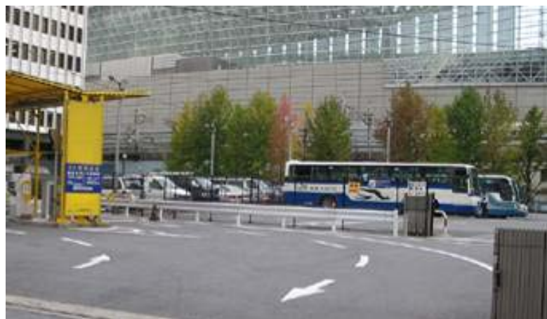
[ 駐車場入り口 ]