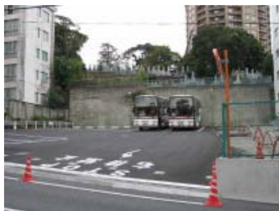
[ 隔地駐車場にて待機中の観光バス ]