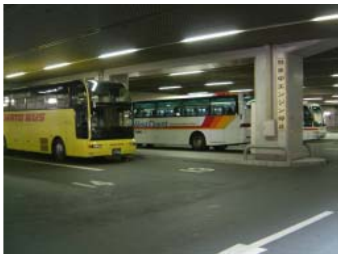
[ 観光バス駐車状況 ]