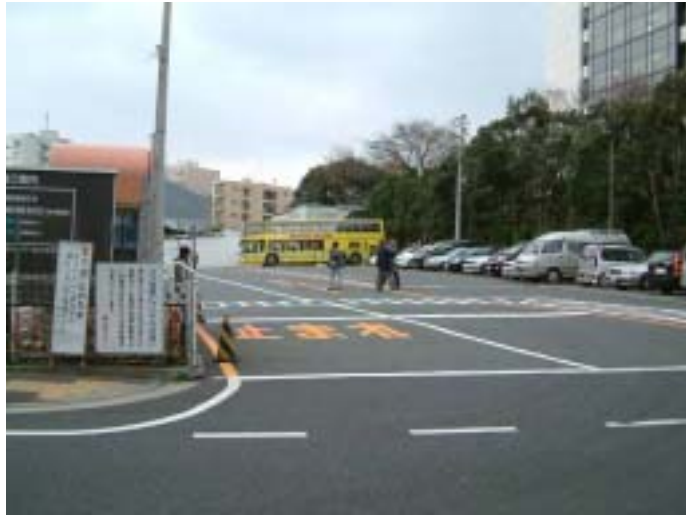
[ 観光バス駐車状況 ]