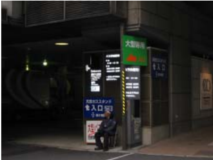
[ 観光バス駐車場入り口 ]