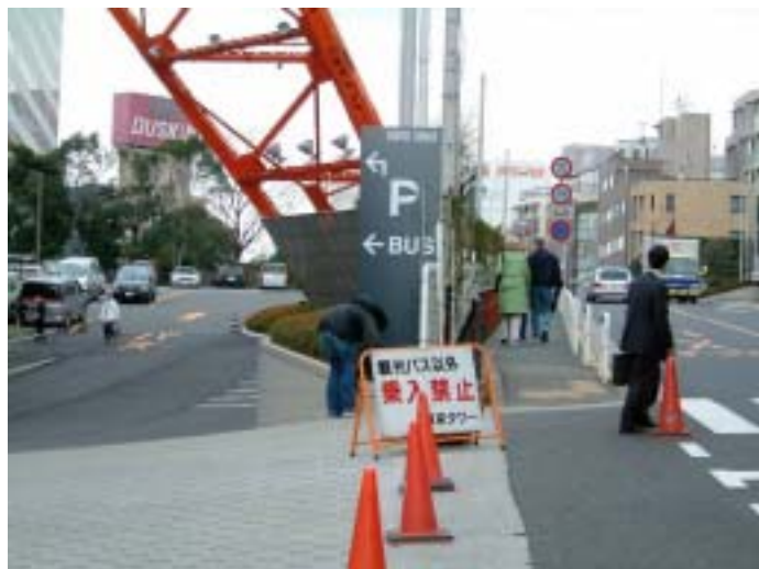
[ 観光バス駐車場入り口 ]