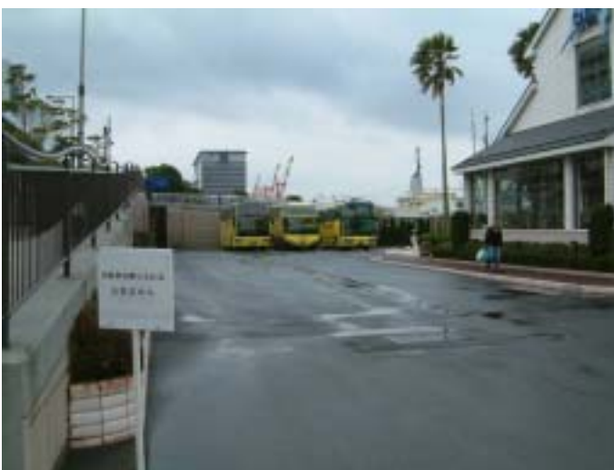
[ 観光バス駐車場入り口 ]