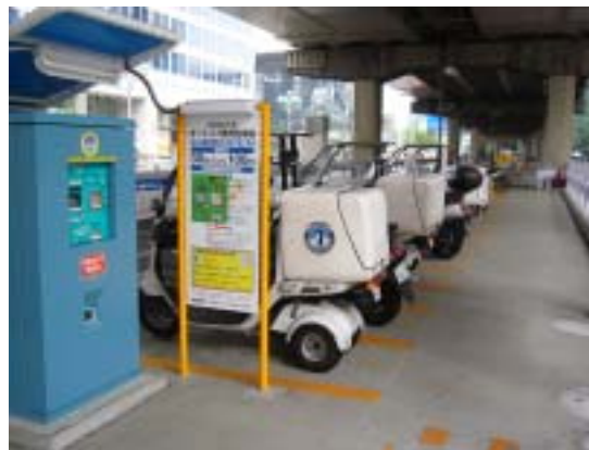
[ 精算機付近 ]