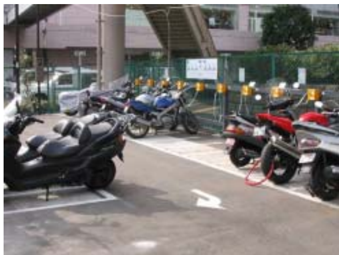
[ 自動二輪車駐車状況 ]