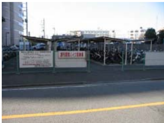
[ 駐輪場入り口付近 ]