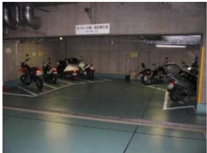
[ 自動二輪車駐車状況 ]