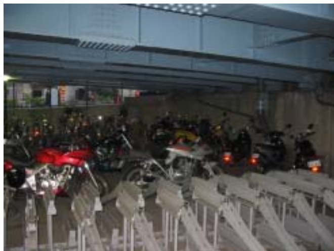
[ 自動二輪車駐車状況 ]