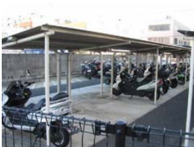
[ 自動二輪車駐車状況 ]