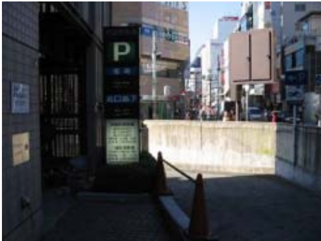
[ 駐車場入り口付近 ]