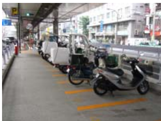
[ 駐車状況 ]