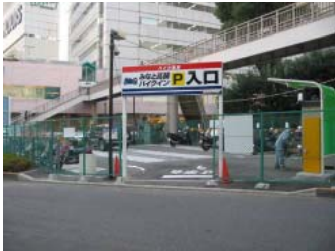
[ 自動二輪車駐車場入り口付近 ]