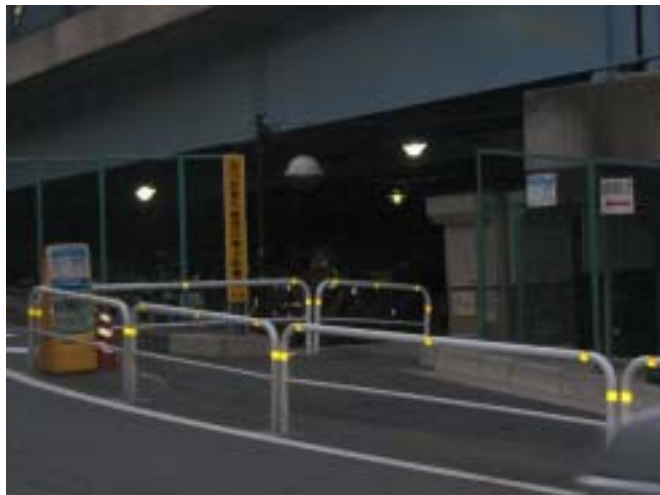
[ 駐輪場入り口付近 ]