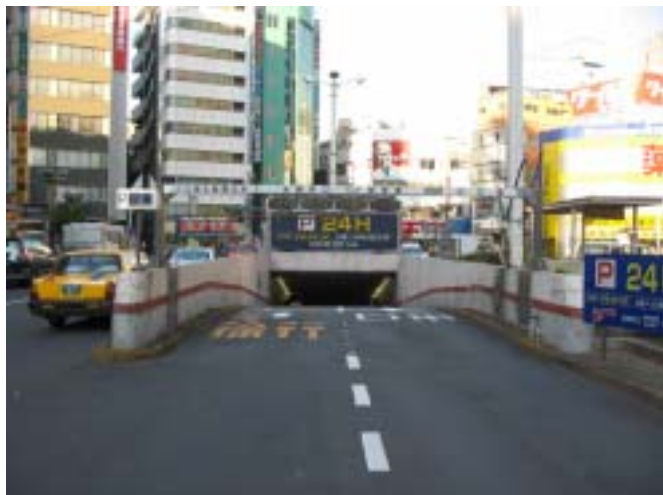
[ 駐車場入り口付近 ]