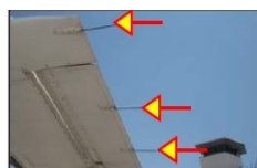
スタティクディスチャージャー(放電索)