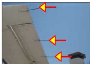
スタティックディス チャージャー(放電索)