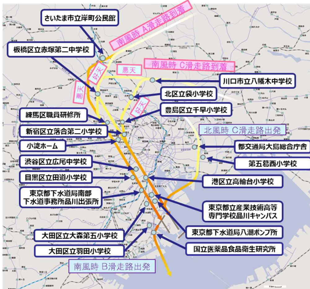
国土交通省 騒音測定局配置図

固定局の設置地点や東京都、各区のモニタリング地点を勘案し全体のバランス、技術的な観点から国交省で選定した測定地点（案）をご提示し、 機器を設置する施設について各区と調整中。