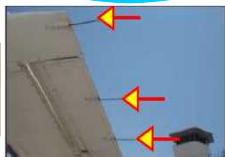
スタティックディスチャージャー(放電索)