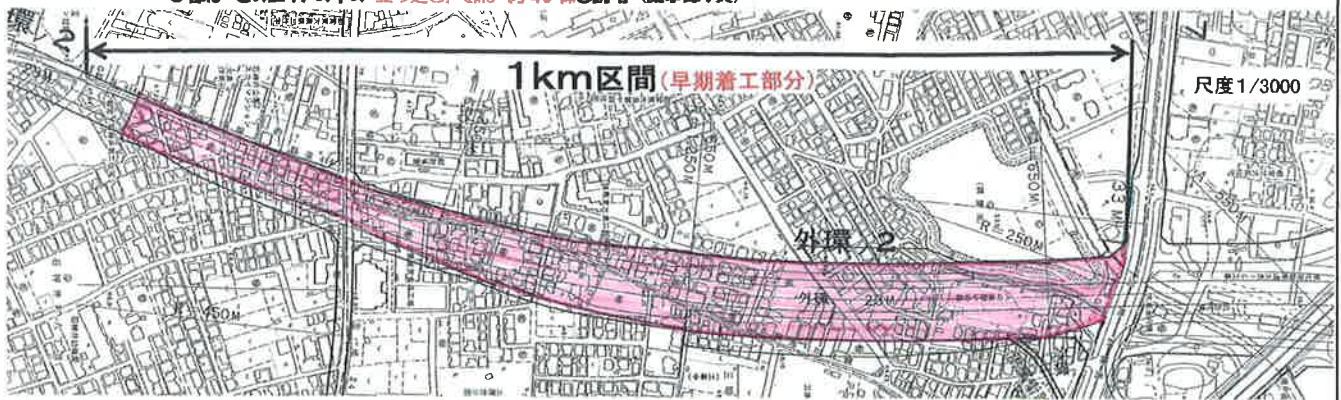
(下段図) 大泉周辺「外環の2」のみに 掛かるエリア (極めて狭い)・・・色部分