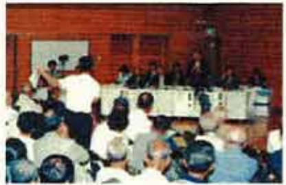
調布市立第八中学校

前号(平成13年4月発行)でお知らせしたとおり、去る4月13日に国土交通省と東京都は、外環(東京外かく環状道路、関越道～東名高速間、約16km)計画の「たたき台」を公表しました。計画の「たたき台」については、パンフレットを作成・配布するとともにホームページ( http://www.ktr.mlit.go.jp/kawaku )にも掲載してまいります。なお、「たたき台」のパンフレットをご希望の方は、国土交通省川崎国道工事事務所(電話044-88886417)、あるいは東京都都市計画局外かく環状道路担当(電話03-5388-3279)までご連絡ください。 今回開催された説明会は、住民の皆さんに「たたき台」の内容を直接説明すると共に、皆さんのご意見をお聞きするためのものです。