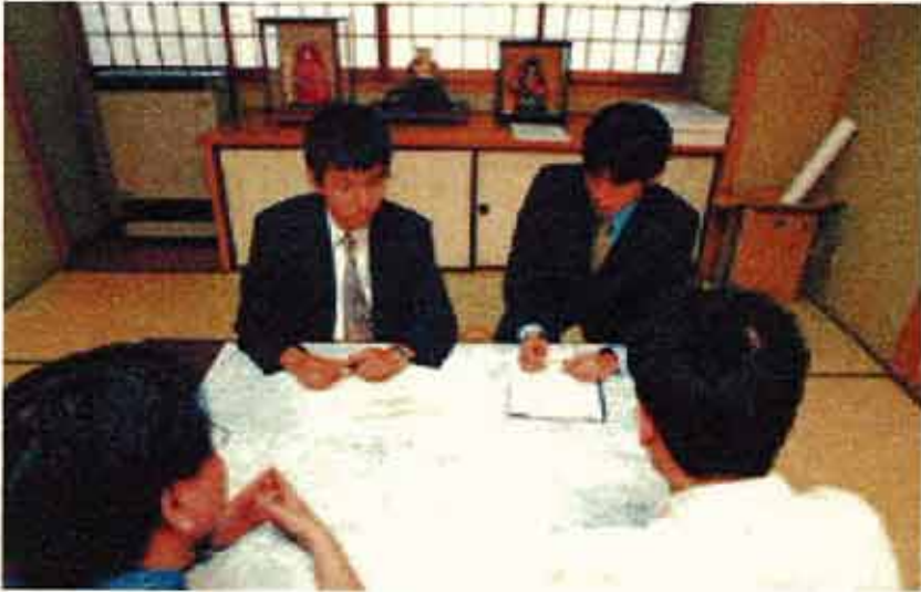
調布市金子地域福祉センターの相談所

国土交通省と東京都では、「たたき台」の相談コーナーは、外環の全般に関する説明を行うために開設し、臨時出張相談窓口を設置しました。 口は外環に関連した個別のご相談をお受けするために設置したものです。