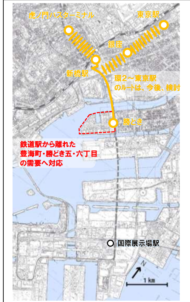
シャトルルート 勝どきシャトル (虎ノ門バスターミナル)～新橋駅～勝どき