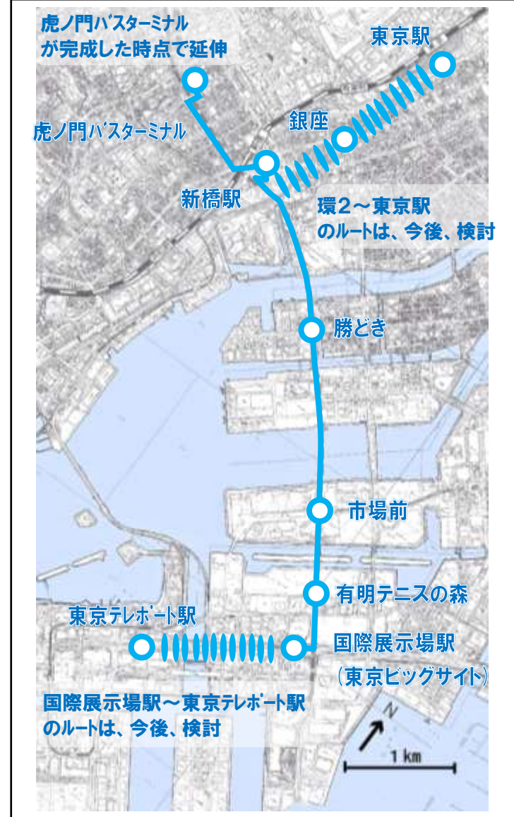
幹線ルート (虎ノ門バスターミナル/東京駅)～新橋駅～ 国際展示場駅～東京テレポート

※ルート・輸送力は、今後実施する将来の需要・採算性の検討等により変更の可能性あり。