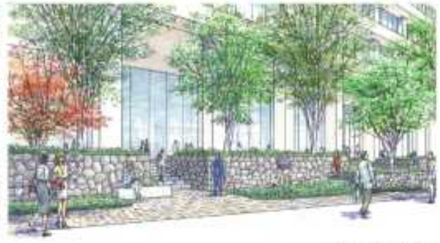
内堀通り西側より