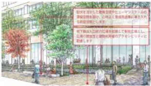
内堀通り東側より