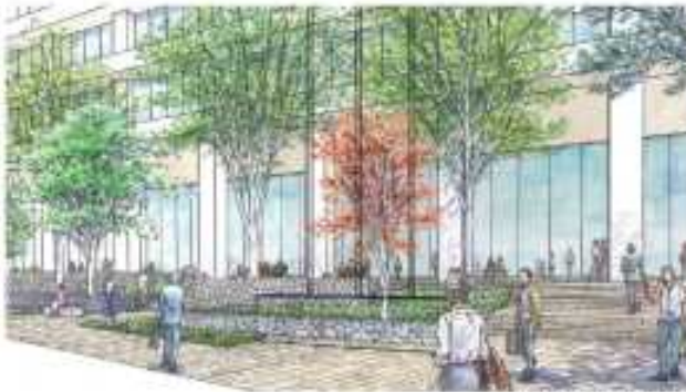
内堀通り東側より