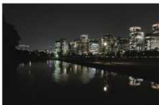
夜景：稲田門内苑より