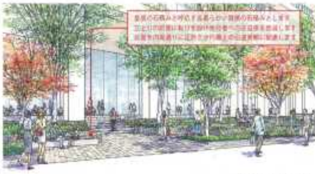
内堀通り西側より