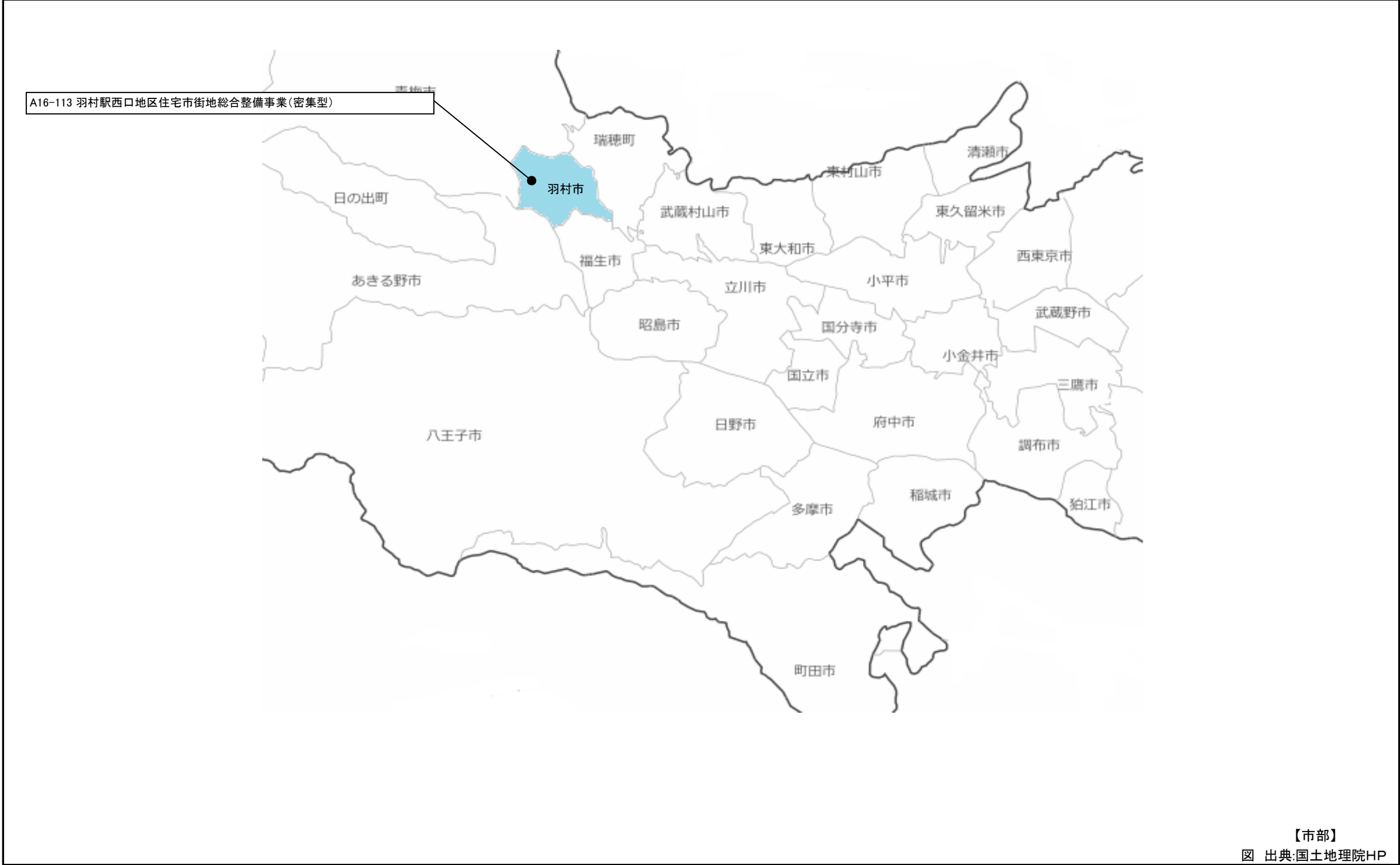
【市部】 図