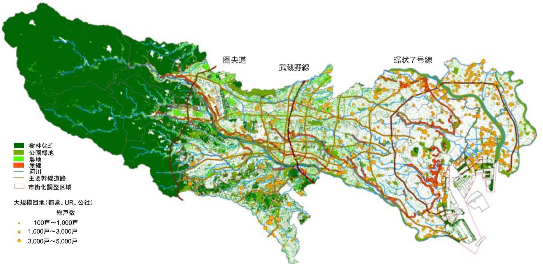
図2 東京のみどり等の現況