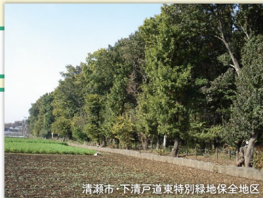
清瀬市・下清戸道東特別緑地保全地区

緑地の有する機能の維持増進を図るために行う立木竹の皆伐または択伐、土地の掘削その他必要な措置