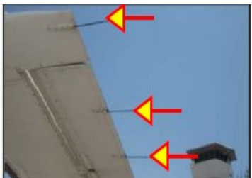
スタティックディスチャージャー (放電索)