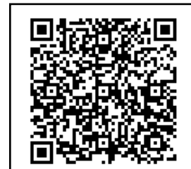
東京都都市整備局

URL： https://www.toshiseibi.metro.tokyo.lg.jp/topics/r05/topi003.html