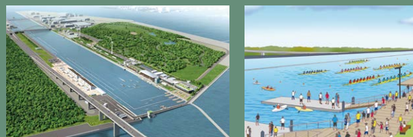
16 海洋森林水上竞技场*