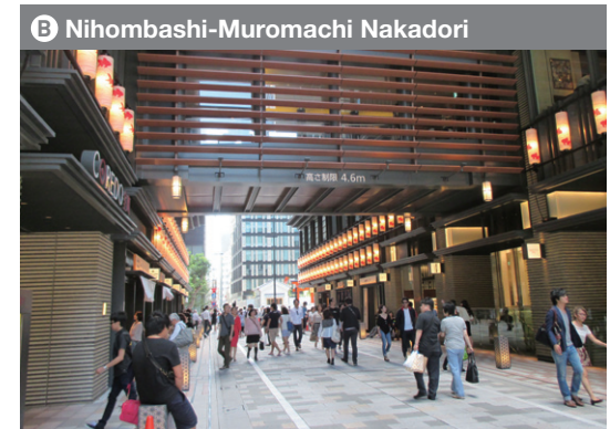
B Nihombashi-Muromachi Nakadori Horário de zona pedonal: Nos dias úteis, fins de semana e feriados: 11:00 a 20:00