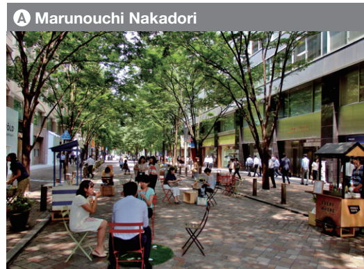
A Marunouchi Nakadori Horário de zona pedonal: Dias de semana: 11:00 - 15:00 Fins de semana e feriados: 11:00 a 17:00