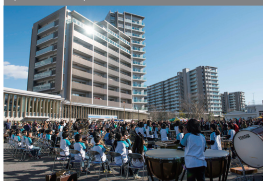
Renovação urbana através da reconstrução de condomínios Renovação do complexo habitacional 2-chome de Suwa (Cidade de Tama)

Construção de instalações, incluindo uma facilidade de apoio para os idosos, o centro de creche para crianças, e o café comunitário.