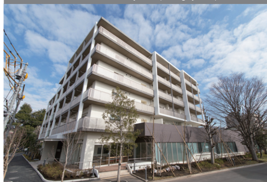
Reconstruindo as residências para acomodar todas as gerações Kosha Heim Chitose Karasuyama (Setagaya-ku)

Reconstrução de habitações construídas durante o período de elevado crescimento económico, desde uma oportunidade para construir instalações, incluindo apartamentos com serviços de alto nível, clínicas, creches, espaços comunitários.