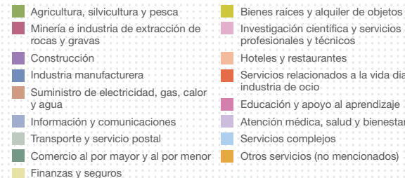
Composición de las empresas por industria (2012) *1