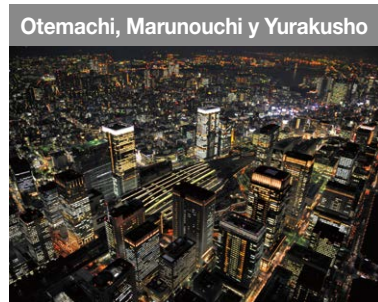
Otemachi, Marunouchi y Yurakusho Los primeros centros de negocios de Japón. En los últimos años, está transformándose en un espacio de ajetreo.