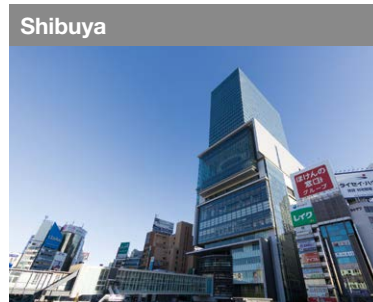
Shibuya En este ajetreado centro de cultura también se está concentrando la industria de tecnología de la información (IT).