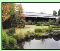
柴又帝釈天題経寺大客殿 （葛飾区）