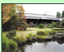
柴又帝釈天題経寺大客殿 （葛飾区）