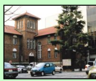
早稲田奉仕園(新宿区)