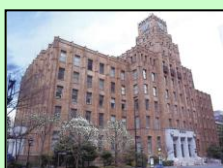
市政会館（千代田区）