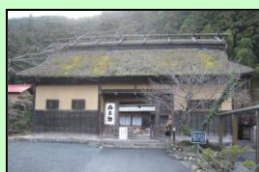
丹三郎屋敷長屋門（奥多摩町）