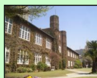
立教大学本館【モリス館】（豊島区）