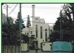
日立目白クラブ（新宿区）