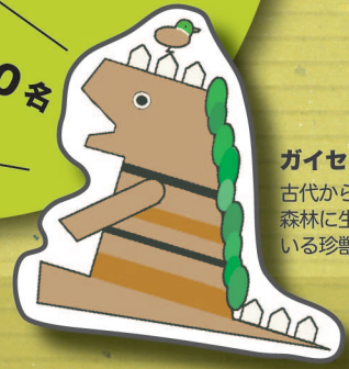
ガイセドン 古代から崖線の 森林に生息して いる珍獣

参加無料、定員は シンポジウム 150名 ウォーキングラリー 200名 お早めにお申し込み下さい。 ※受付は先着順です。