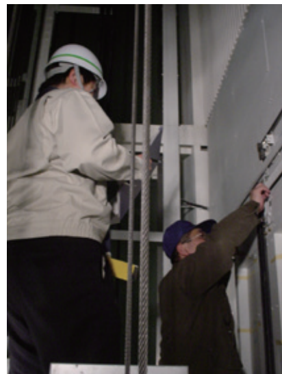
大規模ビルにおける 完了検査