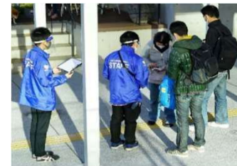
受付の様子 (検温・問診等の実施)