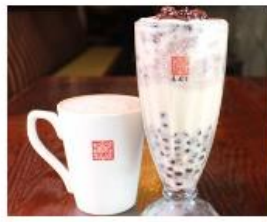
台湾で人気の“飲むお汁粉” グルメ 10月2日