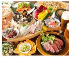
“ハワイア〜ン!”なビアハウス グルメ 10月1日