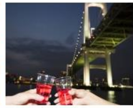
水上から「東京夜景」を堪能してきた おでかけ 10月1日