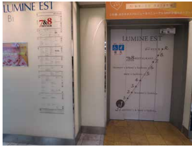
EV-K01 拡大図 (S=1/4)