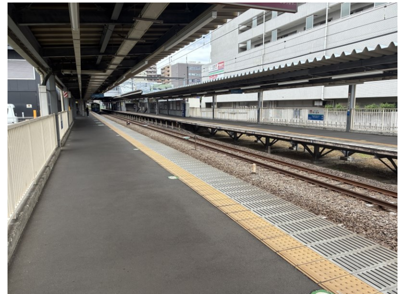
写真：西武 東久留米駅