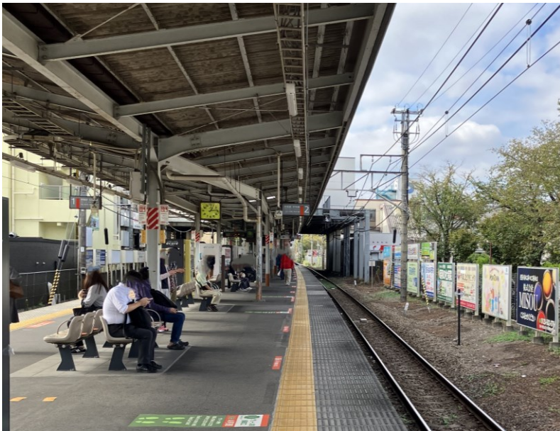
写真：JR 昭島駅（時間帯無人）