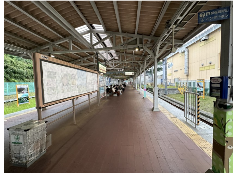
写真：京王 多摩動物公園駅（遠隔対応）