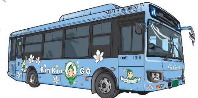
※「いたばしどこでも誰でもおでかけマップ」を一部修正