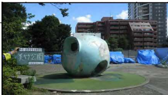
写真：球体遊具(公園施設)