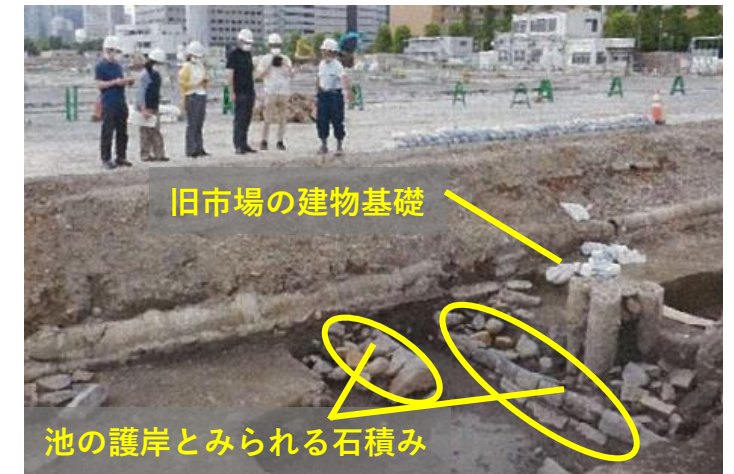
埋蔵文化財調査の状況

埋蔵文化財試掘調査の詳細な報告書については、都市整備局ホームページ「築地まちづくり」( https://www.toshiseibi.metro.tokyo.lg.jp/bosai/toshi_saisei/saisei08.html )をご覧ください。